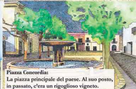
Piazza Concordia: La piazza principale del paese. Al suo posto, in passato, c'era un rigoglioso vigneto.