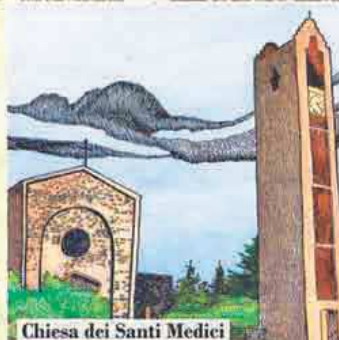
Chiesa dei Santi Medici