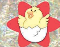
Lecomuseo del paesaggio delle serre di Tuglie