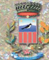
Comune di Tuglie