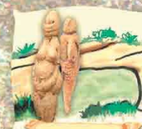
Grotta delle Veneri