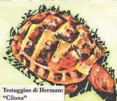
Testuggine di Herman: "Cilona"