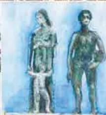
Monumento agli Emigranti: Del 1972, il primo realizzato in Italia.