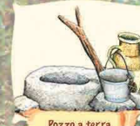
Pozzo a terra