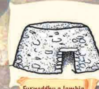
Furneddu a lambia